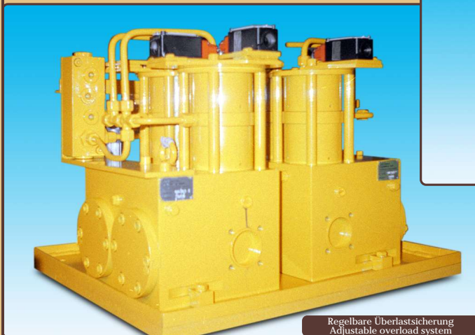
Regelbare Überlastsicherung Adjustable overload system

Overload-safety units for big presses in sheet metal industry