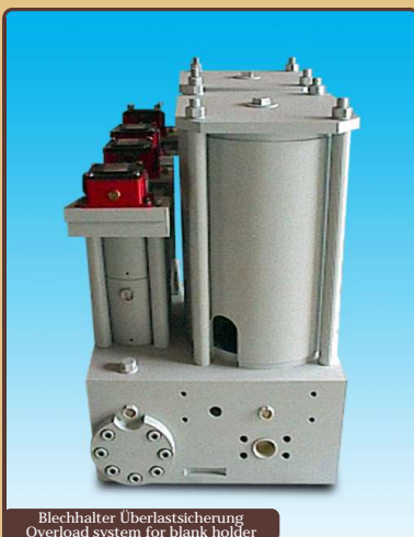
Blechhalter Überlastsicherung Overload system for blank holder