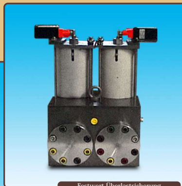
Festwert Überlastsicherung Fix value overload system

These overload-safety units compensate additionally the press force drop in blank holder suspension point by contact between slider and sheet metal.